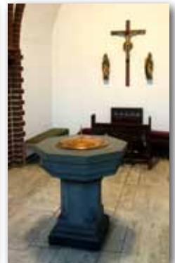
Marienstatue, Innenraum und Taufkapelle in St. Marien