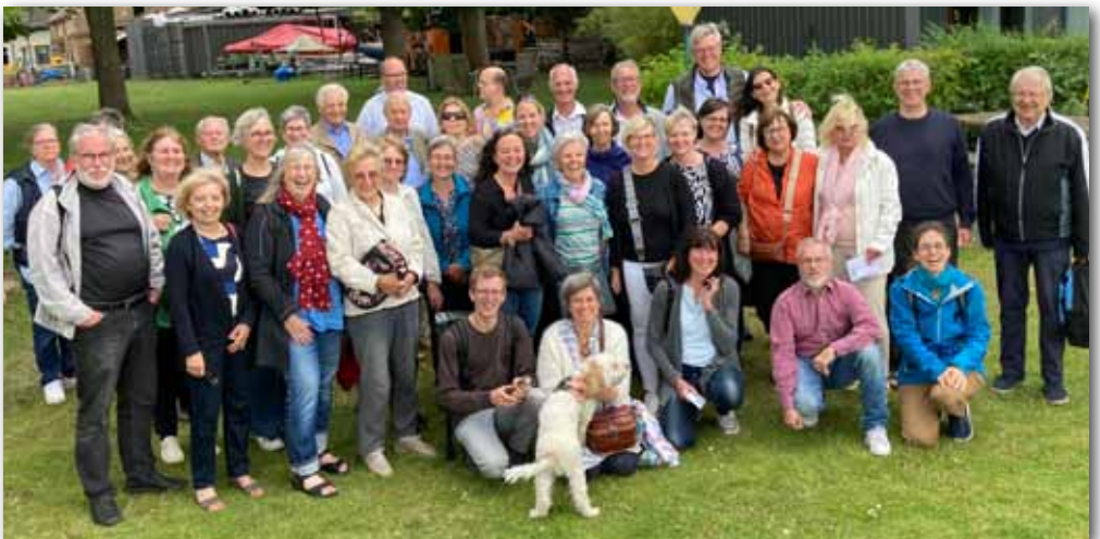
Ausflugsschiffahrt der Ehrenamtlichen von St. Marien Maternitas