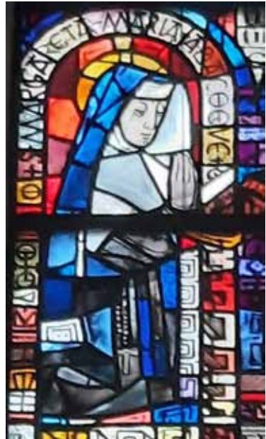
Kirchenfenster mit der Hl. Margareta, Herz Jesu

Und dieselbe Stimme erklang und sagte: „Die Stadt wird viele Gefahren erdulden müssen, aber sie wird geschützt werden.“ Ergebnis: Die feindlichen Sarazenen verschwanden.