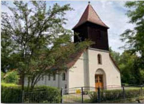
St. Marien Maternitas