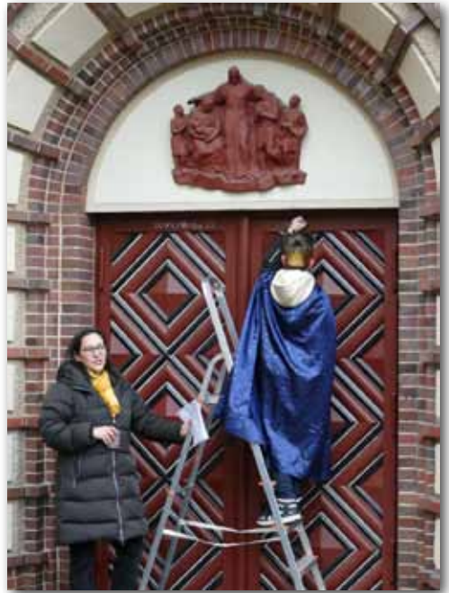
Sternsinger in Konradshöhe