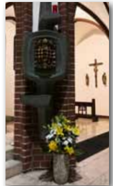
Ambo, Marienaltar und Tabernakel in der Kirche St. Marien