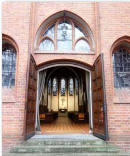
Portale St. Marien