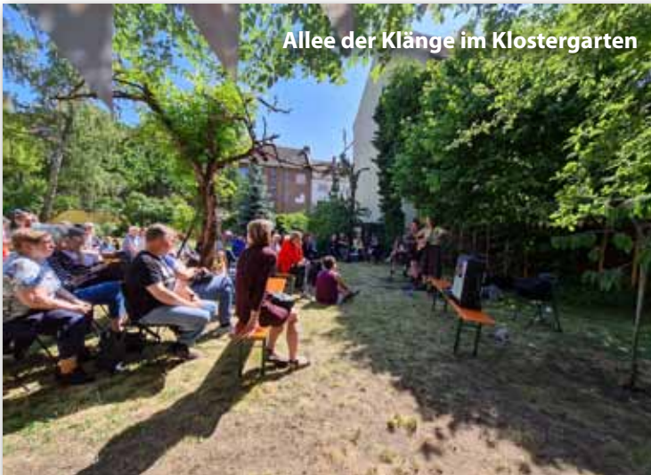
Allee der Klänge im Klostersgarten

wind statt. Es kamen viele Menschen aus dem Kiez, junge und alte, große und kleine. Für jeden gab es Angebote und die Möglichkeit zum Austausch bei gemütlichem Beisammensein. Ein weiteres Highlight war das Adventssingen der Blue Ladies , dem