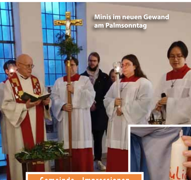
Minis im neuen Gewand am Palmsonntag