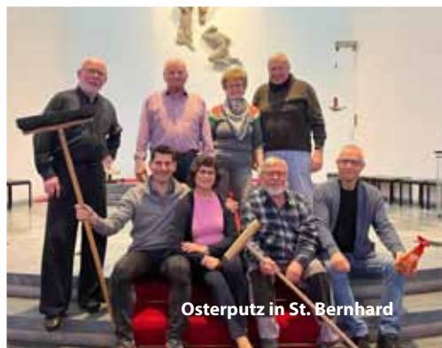
Osterputz in St. Bernhard