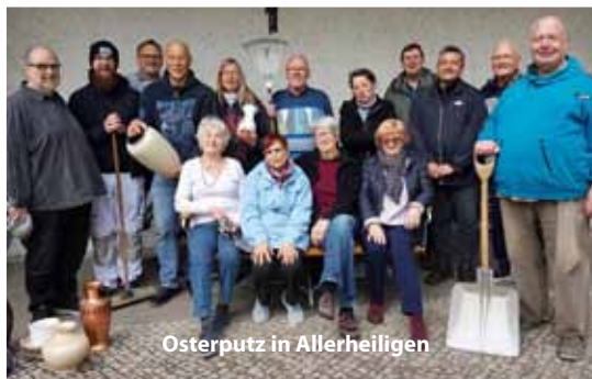
Osterputz in Allerheiligen