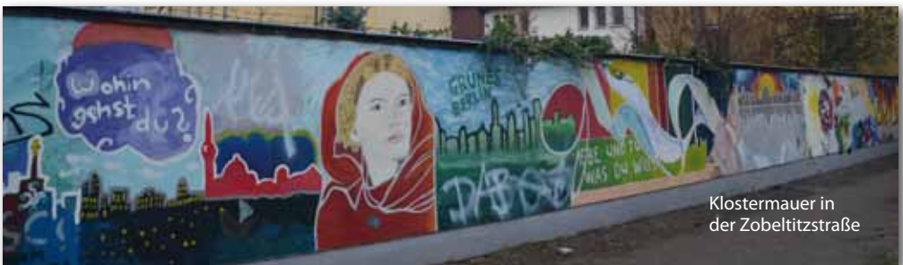
Klostermauer in der Zobelitzstraße

Vom 11. Juli bis 22. August finden die Hl. Messen als besonderer Akzent in der Kapelle statt.