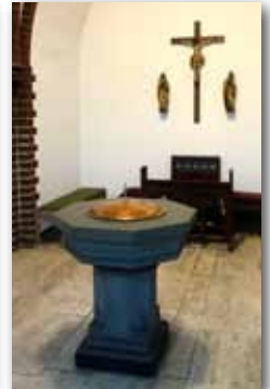
Marienstatue, Innenraum und Taufkapelle in St. Marien