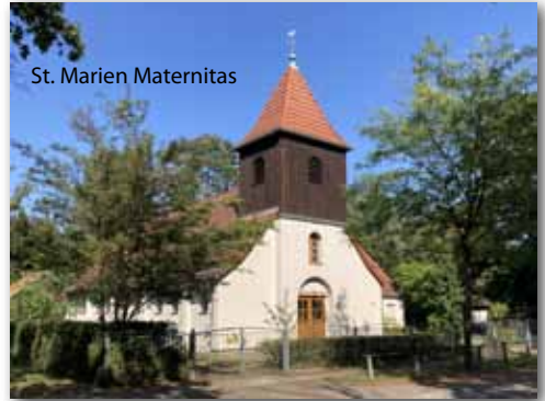
St. Marien Maternitas